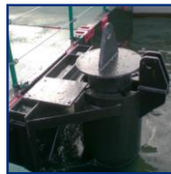
GUIDES PIEUX + PIEUX