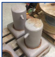
BOLLARDS A SOUDER