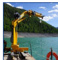
GRUE SUR CHASSIS