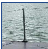
GARDES - CORPS