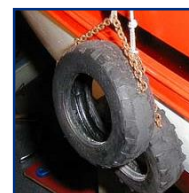
PNEUS PARE BATTAGE